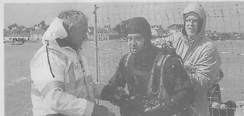
Ce jour-là le plongeur a pu passer le karcher sous le quai mais pas forer.

longs tuyaux de 60 m. « Les liaisons servent aussi à calculer la profondeur, ou à faire passer la vidéo. On peut filmer en direct ce que voit le plongeur. » L'équipe de quatre plongeurs se relaye avec toujours un homme dans l'eau et deux en surface. Chaque plongeur peut passer jusqu'à 3 heures par jour sous l'eau. Tout dépend des conditions météo, et des caprices de la Ria. « Parfois le courant nous empêche de travailler. En général c'est mieux à marée basse. »